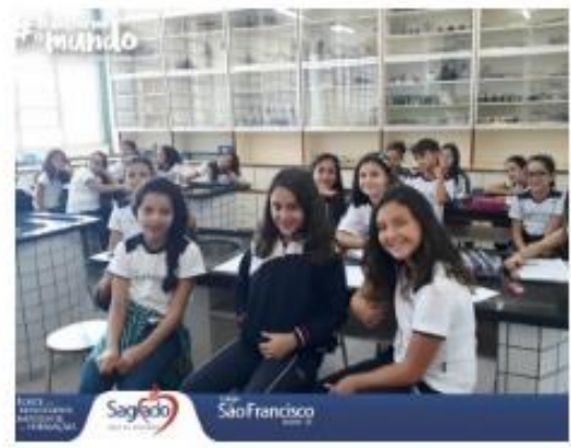
Circuito Elétrico - 5º anos