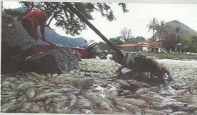
De novo: mortandade de peixes no Rio ocorre todo carnaval.